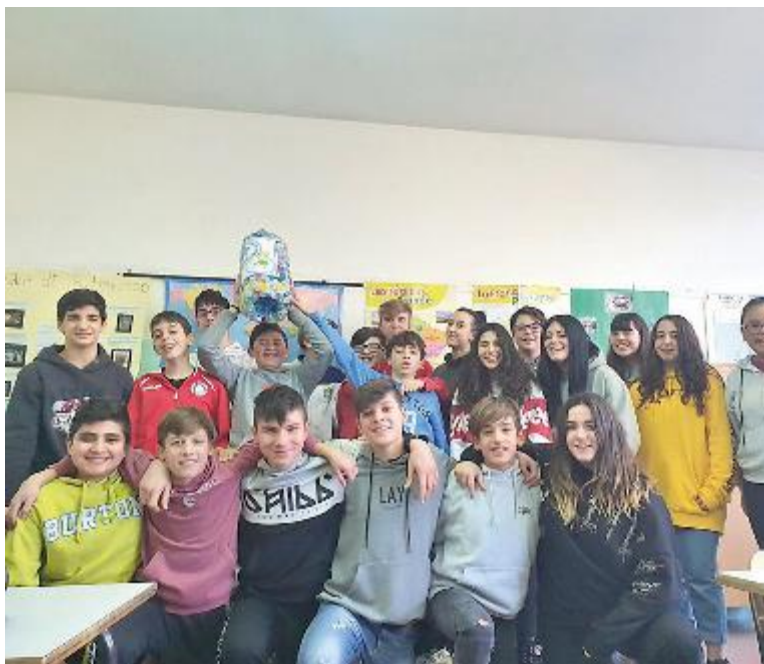
Ecco gli studenti-green della Grecchi

“Animali digitali”, “Orti in città”, “Licenza di riciclo”, “Un albero per amico”